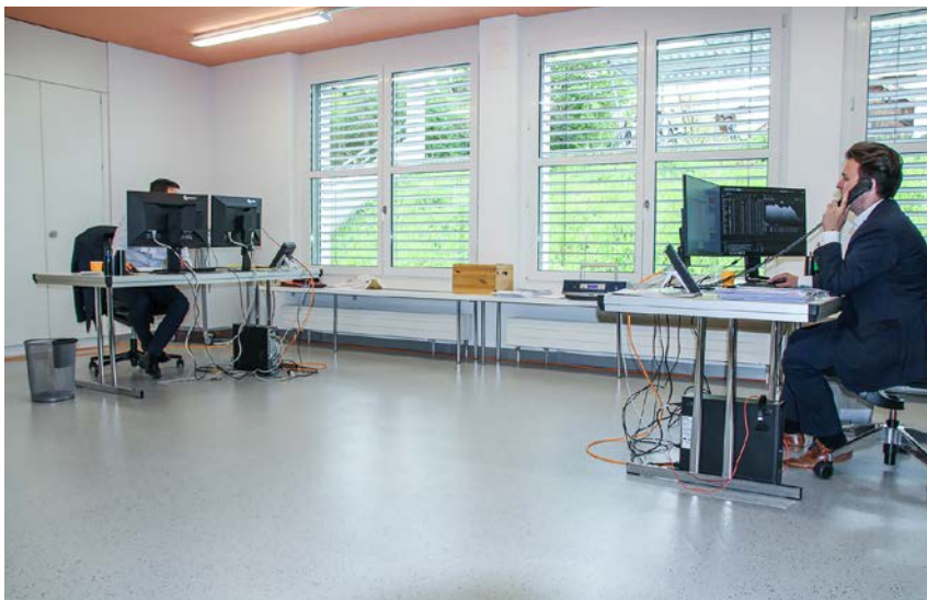
Wo normalerweise Schüler der Musikschule Sarnen ihr Bestes geben, werden derzeit Bankgeschäfte getätigt.

gilt die Regel: Ein Getränk oder eine Zwischenverpflegung fassen und wieder gehen: Social Distancing. Der wichtige persönliche Austausch der Teams und Projektgruppen findet via Telefon- oder Videokonferenz statt. Gut, braucht es dafür keine Sitzungszimmer, denn die sind gerade spärlich vorhanden und schon gar nicht in der zu Corona-Zeiten konformen Grösse.