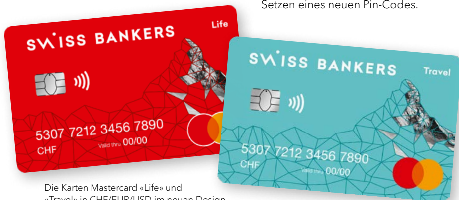
Die Karten Mastercard «Life» und «Travel» in CHF/EUR/USD im neuen Design.

Die überarbeitete App wird von «My Card» zu «Swiss Bankers». Ihr Name hat sich geändert, nicht jedoch ihre nützlichen Funktionen. Über die App sind jederzeit alle getätigten Transaktionen und Ausgabestatistiken abrufbar. Internettransaktionen und einzelne Länder können blockiert oder freigegeben werden. Das Sperren der Karte bei Verlust ist sofort möglich und auch das Setzen eines neuen Pin-Codes.